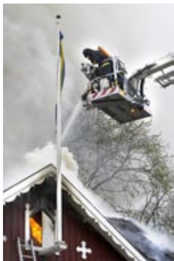
Insatsstyrka på plats för att minimera brandskadorna på den eldhärjade bostaden.

D ET ALLMÄNT MEST positiva när det gäller räddningstjänst under 2004 är den kraftiga nedgången på omkomna i samband med bränder. Jämfört med föregående år sjönk antalet omkomna i landet till 65 jämfört med 134 året innan.